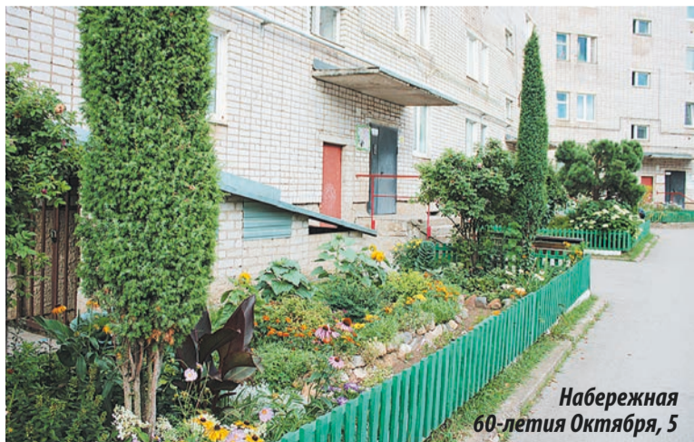
Набережная 60-летия Октября, 5